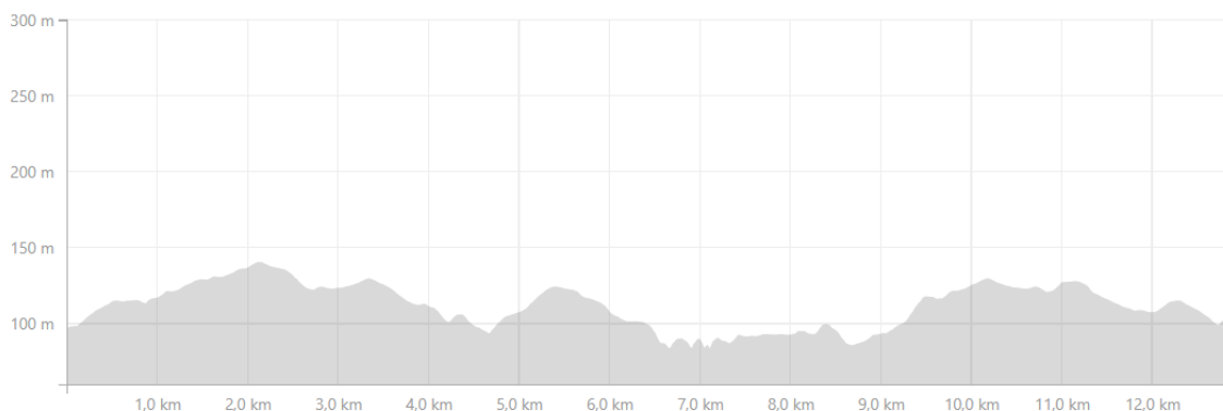
Figura 2 - Altimetria do Percurso